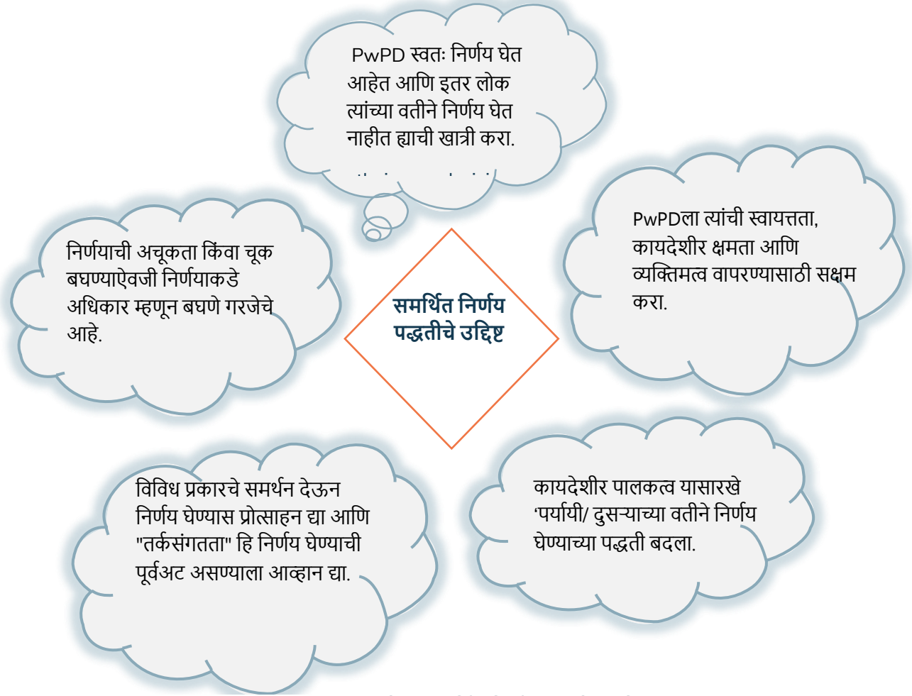
आकृती 2: समर्थित निर्णय पद्धतीचे उद्दिष्ट